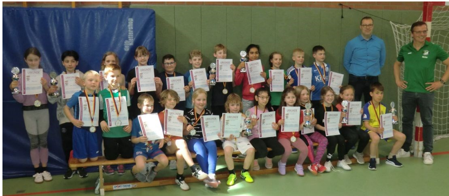
Foto: Sieger und Platzierte des Low-T-Ball-Turniers 2024.