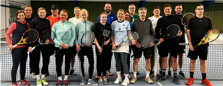
Foto: Die Teilnehmer am Mitternachtsturnier noch weit vor Mitternacht